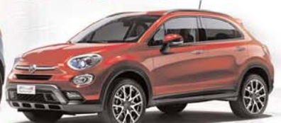
Fiat 500 x

AVDA. LUIS MATEOS, 42 - PARC. 42 B (FRENTE A MICHELÍN) - 09400 ARANDA DE DUERO (BURGOS) - TEL. 947 50 71 44