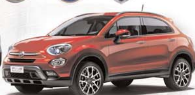
Fiat 500 x

AVDA. LUIS MATEOS, 42 - PARC. 42 B (FRENTE A MICHELÍN) • 09400 ARANDA DE DUERO (BURGOS) - TEL. 947 50 71 44