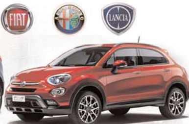
Fiat 500 x

AVDA. LUIS MATEOS, 42 - PARC. 42 B (FRENTE A MICHELÍN) • 09400 ARANDA DE DUERO (BURGOS) • TEL. 947 50 71 44