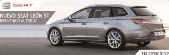
NUEVO SEAT LEÓN ST BIENVENIDO AL ESTILO