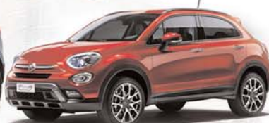
Fiat 500 x

AVDA. LUIS MATEOS, 42 - PARC. 42 B (FRENTE A MICHELÍN) · 09400 ARANDA DE DUERO (BURGOS) · TEL. 947 50 71 44