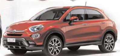
Fiat 500 x

AVDA. LUIS MATEOS, 42 - PARC. 42 B (FRENTE A MICHELÍN) · 09400 ARANDA DE DUERO (BURGOS) · TEL. 947 50 71 44