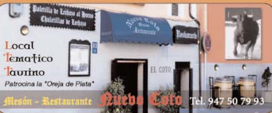
Alés - Restaurante Nuevo Coto Tel. 947 50 79 93

MANTENIMIENTO DE EMPRESAS PINTURA DECORATIVA E INDUSTRIAL